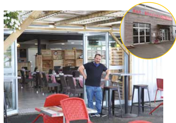
Brasserie Chez Paulette

https://www.facebook.com/dermaslim.64/ www.centre-minceur-antiage.fr