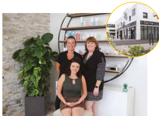
Centre Minceur et Anti-Âge Derma Slim

Pour les contacter 05 59 02 58 88 http://bleriotconduite.e-monsite.com/ https://www.facebook.com/Bleriotconduiteautoecole/