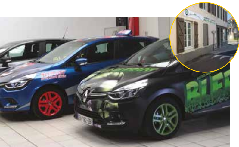
Auto école - BLERIOT Conduite

Nous souhaitons la bienvenue à Elodie DEBAT LESCOLLE et son équipe. « Blériot Conduite » l'auto-école qui bouscule les codes se situe au 2 impasse Galliéni! Vous aurez l'occasion de conduire des clios parées des couleurs de vos super-héros (Batman, Hulk, Captain América) mais aussi elle vous prépare au code, permis moto et BSR.